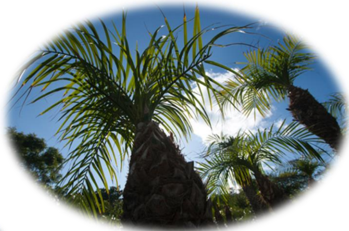
フェニックス・ロベレニー