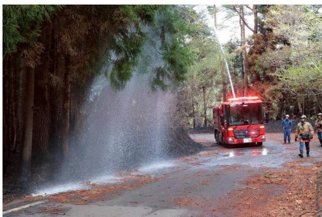
東京都大隊における水槽付き放水車の活動

4月30日 八丈町派遣隊は、指揮隊の支援として現場指揮本部での活動となり、ここでも車両の機動性を活かし、大隊長の現場巡回、前日の熊の出没情報に対する、熊よけスプレー搬送など活動は広がりました。ほか地区では自衛隊のヘリコプターによる消火活動も続いていました。東京都大隊担当地区では水槽付き放水車等の活躍により、水利が乏しい場所にも放水が行われ、延焼は終息傾向となり、午前中には放水活動は終わり、午後からはドローンによる熱源の確認活動となりました。