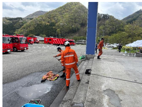
後方支援活動（デコンタミネーション（除染））

4月27日 早朝から食事の準備と提供や東京都大隊が活動拠点とする岩手県上閉伊郡大槌町吉里吉里地区（宿营地から車で約1時間）に出動し、活動隊の活動支援を行いました。火災の範囲は想像以上に広く、水利も乏しいため消火活動は困難を極め大変な活動となりましたが、後方支援隊も活動隊の活動環境を整えるため、万全のバックアップ体制でサポートをしました。