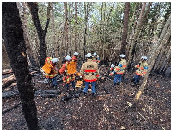
資器材の撤収活動

4月30日 八丈町派遣隊は、指揮隊の支援として現場指揮本部での活動となり、ここでも車両の機動性を活かし、大隊長の現場巡回、前日の熊の出没情報に対する、熊よけスプレー搬送など活動は広がりました。ほか地区では自衛隊のヘリコプターによる消火活動も続いていました。東京都大隊担当地区では水槽付き放水車等の活躍により、水利が乏しい場所にも放水が行われ、延焼は終息傾向となり、午前中には放水活動は終わり、午後からはドローンによる熱源の確認活動となりました。