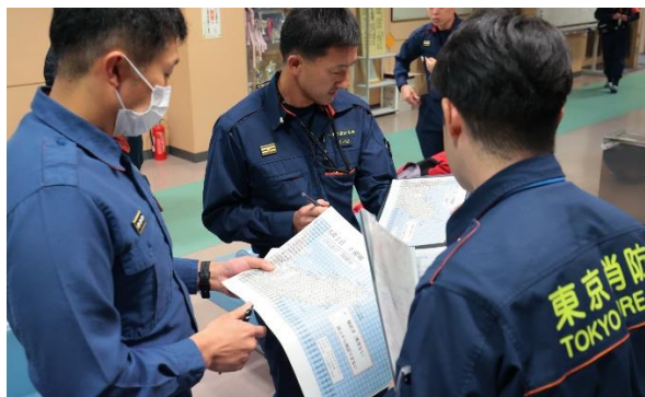
翌日の活動内容の説明

15時より雨降る中、現場確認のため東京活動隊として車両に乗り込みました。災害現場はこれまでの消火活動と4月28日の雨、この日降雨量80mmと予想され小康状態ではありましたが、19時まで確認活動を実施し宿営地へ引上げました。その夜のミーティングで翌日の八丈隊活動にあっては、グリッドマップの未確認マスを確認し埋めていくことを指示されました。