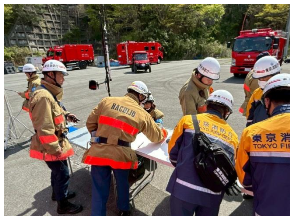
現場指揮本部における指揮隊支援活動

5月1日 八丈町消防本部第2次派遣隊を含む東京都大隊第6次派遣隊（40隊約130名）が昼頃に宿営地に到着となり、申し送りを行い、活動を引継ぎました。宿営地を15時20分発のバスに乘車し盛岡駅まで行き、そこから東北新幹線へと乗り継ぎ、島嶼会館へは夜21時00分に到着となりました。