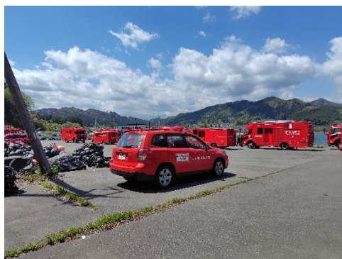
吉里吉里漁港にある東京都大隊指揮本部

5月3日 4時30分、大槌町長及び釜石大槌地区行政事務組合消防本部消防長からの挨拶。5時に宿営地を出発し、13時に佐野 SA 到着。その場で東京都大隊の解団式を実施し解散しました。15時15分、島嶼会館に到着し、八丈隊としての活動は終了しました。