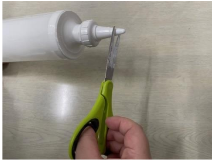
チューブノズルの先端を切って開封する