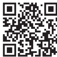
八丈島歴史民俗資料館の歴史