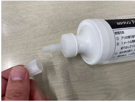
チューブノズルの先端をまわして開ける