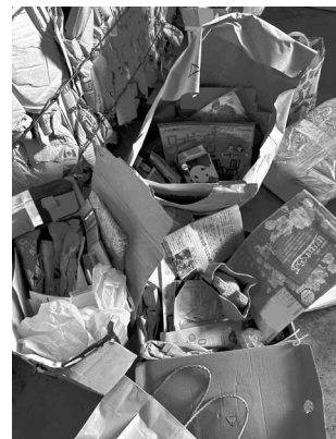
ビニールが付いたままの雑誌や燃やせるごみ、ダンボールなどが混ざった状態で出された古紙類