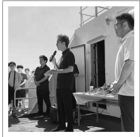
青龍丸戦没者追悼式（おがさわら丸船上）

父島二見港の入港時は晴天に恵まれ、小笠原村役場職員の方をはじめ多くの住民の皆さんにお出迎えいただきました。その日の夜は、二見港船客待合所において歓迎交流会を開いていただき、会場には訪問団の皆さんも大勢参加され、小笠原の郷土芸能である南洋踊りや郷土料理と小笠原の魅力を堪能しました。