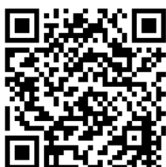
都立学校公開講座一覧

https://www.syougai.metro.tokyo.lg.jp/sesaku/kaihou/koukaidenshi.html