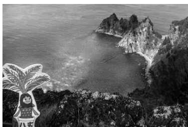
小笠原親善訪問楽しかった！