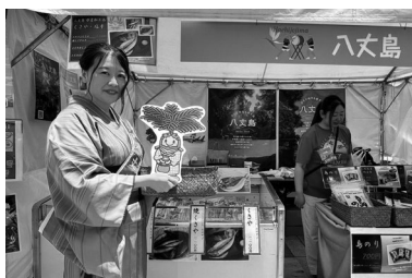
ミス八丈とイベントに参加

町の木「フェニクス・ロベレニー」をモチーフにした東京都立 青鳥特別支援学校八丈分教室生徒の皆さんによるアイデアを基 に、島内デザイナーと調整を重ね誕生しました。