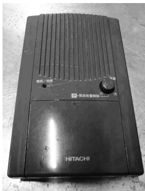
*アナログ戸別受信機

なお、デジタル戸別受信機を受け取った方で、防災行政無線を受信できない場合は総務課へご連絡ください。