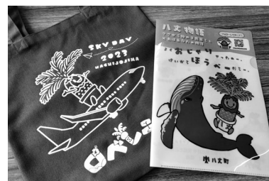
ぼくのグッズも増えてきたね