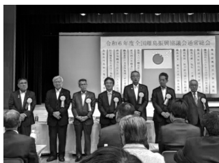
全国離島振興協議会新役員（山下町長副会長に選任）