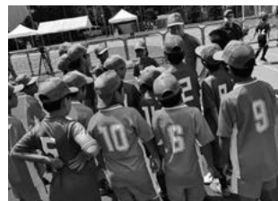
愛らんどリーグ（八丈島FCと町長）