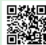
八丈町立図書館 ホームページ