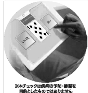
※本チェックは疾病の予防・診断を目的としたものではありません