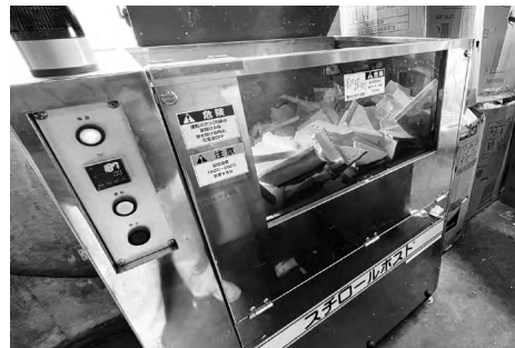
手選別後、機械で溶かしてインゴット状にします

機械によって減容されインゴット状になった発泡は最終的には、島外搬出され、プラスチック製品へと生まれ変わります。燃やせるごみの焼却量が減り、CO 2 の削減にも繋がります。