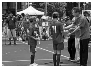
八丈島FC優勝（表彰式）