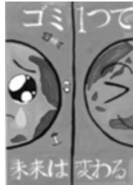
佳作 富士中学校1年