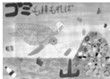
佳作 三原小学校6年