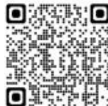
申込 QR コード

本件に関する問い合わせ先：東京都島嶼町村一部事務組合 廃棄物対策課 電話 03-3432-4961