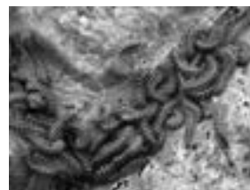
ヤンバルトサカヤスデ（成体）

大賀郷地域にお住まいの方は環境係、他の地域にお住まいの方は各出張所にて引換券または助成券を お受け取りください。また、島内に別荘や事業所を所有し管理している方も半額の助成券を環境係にて お渡しします。※引換期限がありますのでご注意ください。