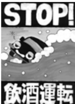
優秀 三原中学校2年