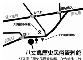
八丈島歴史民俗資料館 バス停「歴史民俗資料館」から徒歩1分