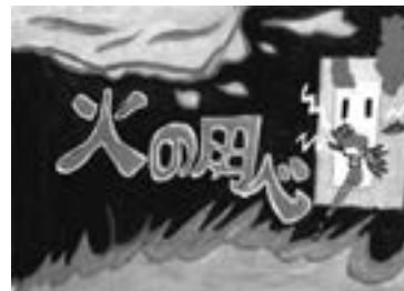
佳作 三根小学校 3年