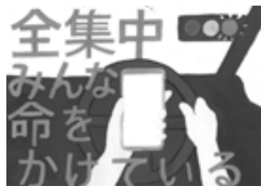
佳作 大賀郷中学校1年