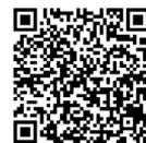
島しょ振興公社ホームページ 地域振興補助事業

■問い合わせ■ （公財）東京都島しょ振興公社 電話 03-5472-6546 企画財政課企画係 電話 2 - 1120