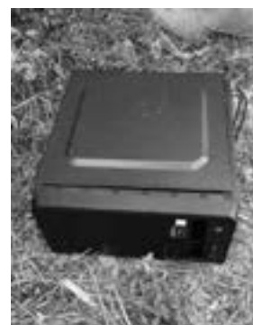
集積所に出されたパソコン