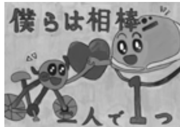
佳作 三原小学校6年