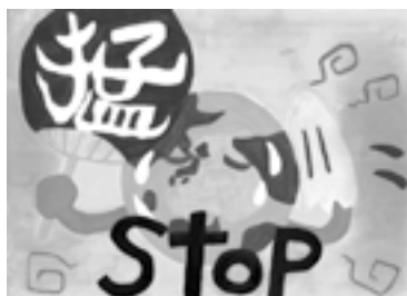
佳作 三根小学校5年