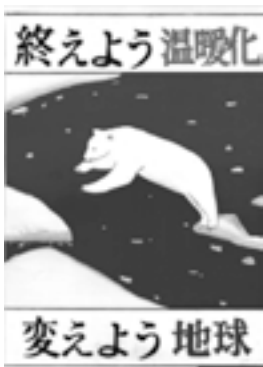
優秀 大賀郷中学校2年