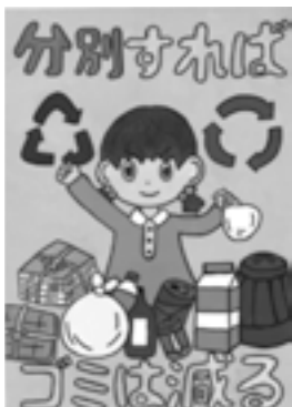
優秀 三原小学校6年