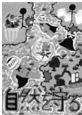
佳作 富士中学校2年