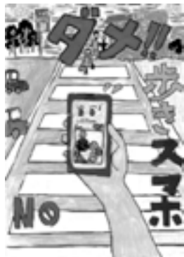
佳作 三根小学校5年