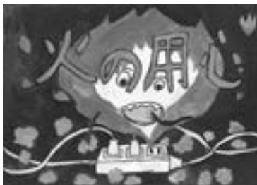
優秀 三原小学校 3年