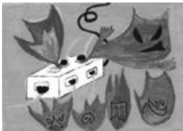
佳作 三根小学校 4年