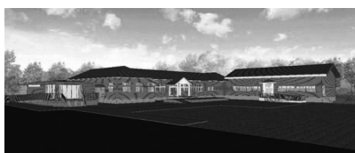
リニューアルオープン後の完成イメージ