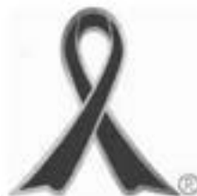
子ども虐待防止 オレンジリボン運動

平成 16 年度から、児童虐待防止法が施行された 11 月を「児童虐待防止推進月間」と定め、児童虐待問題に対する社会的関心の喚起を図るため、集中的な広報・啓発活動を実施しています。