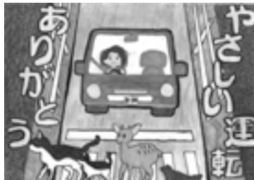
優秀 三根小学校5年