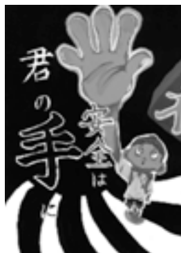
佳作 富士中学校3年