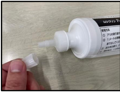
チューブノズルの先端をまわして開ける